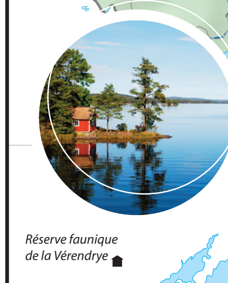
Réserve faunique de la Vénéry